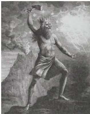
Рис. 5. Тор — скандинавський бог, найсильніший вправний воїн. Панує блискавкою і бурею, перемагає будь-які труднощі