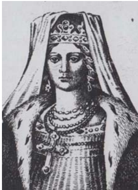
Рис. 1. Київська княгиня Ольга, засновниця та одноосібна правителька Русі-України (945—964)

У давньоруській літературній пам'ятці "Повість минулих літ" є випадково збережені — після численних упорядкувань і відвертих підрбок — рядки [1, с. 59; 2, с. 41; 3, с. 106; 4, с. 5, 8, 9; 5, с. 8; 12; 13]. Ніби звичайні, а насправді потужні й глибинні, вони відтворюють метрику величезної країни раннього європейського середньовіччя, заснованої в землях Східнослов'янської рівнини з центром — столицею Києвом. Слова, що віщували зміни, підтверджували могутність і силу: "В лето 6455 (947) 11 апреля. Пасха. Иде Ольга к Новгороду, и уставы по Мсте погосты и дань и по Лузе погосты и дань и оброки, и ловищаеа суть и по всей земле и места и погосты... изрядивши, взратися к сыну своему в Киев" (рис. 1, 2).