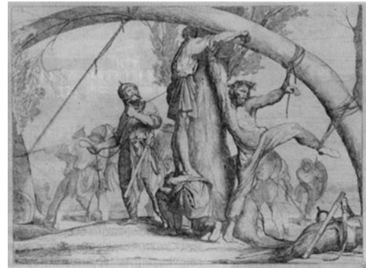
Рис. 4. Убивство Ігоря деревлянами

Смерть очільника війська з Києва виняткова — потрійно ганебна! У мирний час, від рук підкорених, рабів, у неприродний і принизливий спосіб (рис. 4). Вияв змови та злого наміру тих, хто мав захищати; кара за відмову від їхньої опіки та заступництва. Загибель першої особи ознаменувала початок змагань.