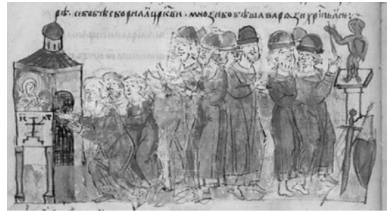
Рис. 3. Клятва русичів у вірності мирній угоді між Києвом і Царгородом, 944 р.

Слід зауважити, що віра тогочасного люду була міцно пов'язана з існуванням богів: визнання їх присутності, причетності та безпосередньої участі у всіх земних справах було непорушним. Унаочнює цю думку рис. 3, на якому зображено присягання війська русів-скандинавів після укладання мирної міжнародної угоди з Візантією 944 р. Язичники (багатобожні) присягалися біля стовпчастого зображення княжого бога — Рудобородого Тора, вирізьбленого з дерева, на зброї; християни — у соборній київській церкві Святого Іллі. Ілюстрація свідчить про наявне двовір'я й водночас приховане протистояння двох віросповідань. Утім, у значній частині князівської дружини виразне тяжіння до християнської віри як латентне визнання й підтримання віри очільника. Без належності конунга Ингвара до Христа подібне не могло відбуватися. Свідчення — у підписах на ратифікаційних грамотах. Перевагу надано єдинобожним вірянам, вони — перші [27, с. 9; 28, с. 67; 29, с. 54].