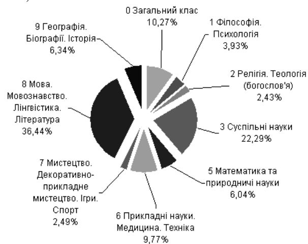
Діагр. 1. Розподіл книг та брошур за класами УДК

9 Географія. Біографія. Історія — 1123 записи, або 6,34%.