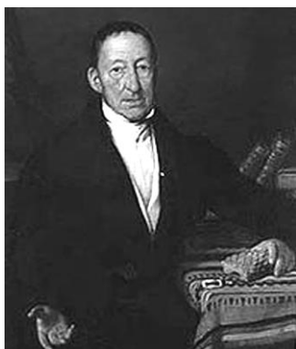
Фото 1. Портрет графа К. М. Штернберка (австрійський художник А. Сларот, 1836, полотно, олія; зібрання граду "Чеський Штернберк";

репліка з Національного музею (Прага) ( http://wikipedia.us.nina.az/wiki/Kaspar_Maria_von_Sternberg )