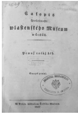
Фото 3. Титульний аркуш першого періодичного музеологічного видання Національного музею у Празі (1827). Зберігається у відділі бібліотечних зібрань та історичних колекцій НБУВ

Першим редактором став історик, доктор Ф. Палацький (František Palacký, 1798—1876). Після 1838 р. цю посаду обійняв філолог-славіст П. Й. Шафарік (Pavel Jozef Šafařík, Šafařík, 1795—1861). Спочатку часопис виходив чеською та німецькою мовами, а від 1832 р. — чеською. З перших номерів на його шпальтах друкували матеріали з історії музейництва на чеських землях, висвітлювали поточні справи Національного музею, а також оприлюднювали наукові праці його співробітників. За пропозицією професора філології, поета, перекладача Ф. Л. Челаковського (František Ladislav Čelakovský, 1799—1852) було ухвалено рішення про ведення музейної документації чеською мовою. Свої праці друкував і К. Штернберк. Їх доцільно розподілити на дві групи: до першої входять власне природничі статті, а до другої — своєрідні наукові звіти про діяльність музею з характеристикою нових надходжень натураліїв та артефактів [12; 21—23]. У 1831 р. при музеї було створено видавництво Maticе česká, що видавало наукову літературу чеською мовою, його секретарем став філолог-славіст, професор Й. Юнгманн (Jozef Jungmann, 1773—1847) [17].