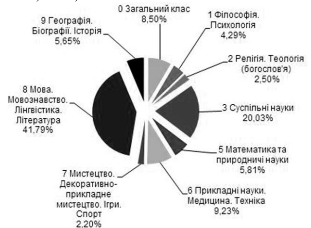
Діагр. 1. Розподіл книг і брошур за класами УДК

Результати бібліометричного аналізу бібліографічної інформації про книги та брошури в межах класів УДК наведено в табл. 1—10 (кількісний і відсотковий розподіл відповідно до загальної кількості записів у класі).