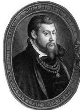
Фото 4. Ганс Меліх (Hans Mielich) "Портрет Самуеля фон Квіккеберга" (бл. 1556); ( https://de.wikipedia.org/wiki/Samuel_Quiccheberg )

на та світська поезія; IX. Музика; X. Граматика та філологічний коментар (фото 4—5) [27].