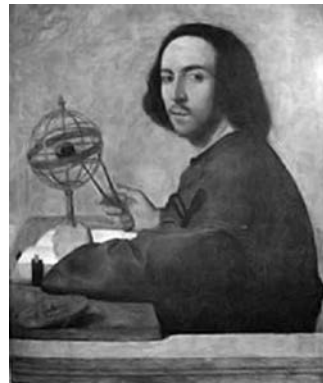
Фото 1. Марко Базаїті "Портреті астронома" (1512), Львівська національна галерея мистецтв імені Бориса Возницького

На відміну від середньовічного теократизму на перший план культури Ренесансу виступили гуманістичні, антропоцентричні мотиви (праці Джованні Піко делла Мірандоли (Giovanni Pico della Mirandola), Франческо Петрарки (Francesco Petrarca)). Ці вчені мали приватні зібрання книг, монет і медалей, творів мистецтва, музичних інструментів. Зокрема, у "Портреті астронома" (1512, олія, полотно, 102 x 83 см) художника венеційської школи Марко Базаїті (Marco Bazaiti, бл. 1475 — після 1530), що експонується у Львівській національній галереї мистецтв імені Бориса Возницького, можна побачити типовий портрет ученого доби Відродження (фото 1) [8].