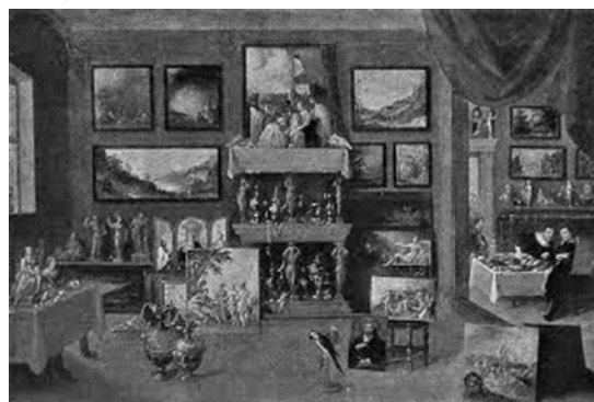
Фото 3. Давид Тенірс Молодший і Франс Франкен II "Кабінет любителя мистецтв", Національний музей мистецтв імені Богдана та Варвари Ханенків (м. Київ)

графіки, на яких репрезентовано зібрання природничо-історичного та наукового характеру, а до другої — колекції творів живопису та декоративно-прикладного мистецтва. Однак на певних картинах бачимо комплексні зібрання, що охоплюють як природничі колекції, анатомічні препарати, "курйозні" речі, так і твори декоративно-прикладного мистецтва й живопису. У Національному музеї мистецтв імені Богдана та Варвари Ханенків експонується картина представників фламандської школи — Давида Тенірса Молодшого (1582—1649) та Франса Франкена II (1581—1642) — "Кабінет любителя мистецтв" (олія, полотно, 58,5 x 86,5 см, рік написання не визначено) (David Tenirs d. Ä, Frans Francken II "Das Kabinett des Kunstliebhabers", Flandren) (фото 3) [21].