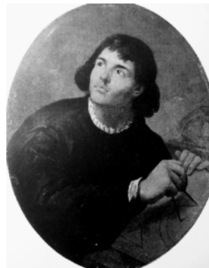
Фото 2. Марчелло Баччареллі "Портрет Коперника", Національний музей у Варшаві

Припускаємо, що на картині зображено польського вченого Миколая Коперника (Nicolaus Copernicus, 1473—1543). Можна порівняти цей портрет із картиною "Портрет Коперника" італійського та польського художника, представника пізнього бароко та класицизму, професора Королівського університету у Варшаві Марчелло Баччареллі (Marcello Filippo Antonio Rietro Francesco Vacciarelli, 1731—1818) (фото 2) [9].