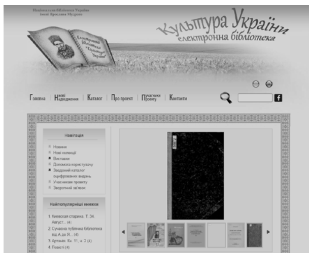
Фото 2. Електронна бібліотека "Культура України" Національної бібліотеки України імені Ярослава Мудрого

На сайті Вінницької обласної універсальної наукової бібліотеки імені Валентина Отамановського (ВОУНБ ім. Валентина Отамановського) сформовано потужний електронний ресурс ( https://library.vn.ua/e-library/meta-e-biblioteku ) для надання віртуальним користувачам нових можливостей роботи з фондом книгозбірні. Електронна бібліотека репрезентує в мережі Інтернет оцифровані рідкісні та цінні видання, у тому числі краєзнавчі твори, що зберігаються в її фонді (фото 3). У такий спосіб бібліотека намагається забезпечити рівні можливості вільного доступу користувачів до творів вінницьких письменників і краєзнавчих досліджень з метою їх популяризації.