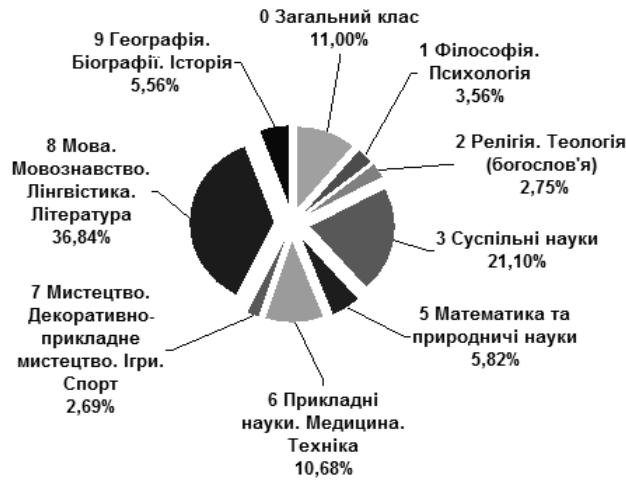
Діагр. 1. Розподіл книг і брошур за класами УДК

9 Географія. Біографії. Історія — 756 записів, або 5,56%.