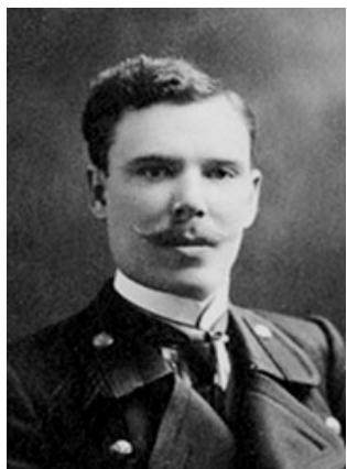
Фото 4. О. Федоровський

У журналі "Наука на Україні" також надруковано дві статті видатного геолога, палеонтолога, археолога, пам'яткознавця та музеєзнавця, професора О. Федоровського (1885—1939). У першій статті йдеться про діяльність Археологічного семінару, започаткованого науковцем 1919 р. при Музеї археології Харківського університету (очолював музей у 1919—1934 рр. чи до 1936 р.) [19]. Автор був членом Всеукраїнського комітету охорони пам'яток мистецтва та старовини, Всеукраїнського археологічного комітету, Українського комітету охорони пам'яток культури [35; 36]. У другій статті О. Федоровський аналізує музейні предмети золотоординського часу [21]. Невелику за обсягом публікацію присвячено дослідженню та збереженню шляхом організації заповідника античного міста Ольвія під Миколаєвом (фото 4) [20].