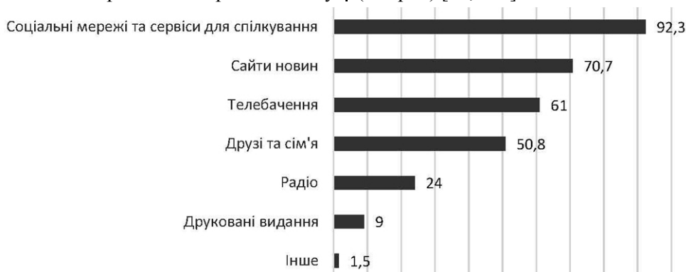
Діагр. 1. Джерела інформації для одержання новин за місяць (липень 2022 р.)

опитувань серед українського населення. Зокрема, щоденникове дослідження "Споживання новин в Україні", проведене Київським міжнародним інститутом соціології в липні 2022 р., виявило, що більшість респондентів використовували соцмережі для пошуку новин за останній місяць — 92,3%, далі йдуть інтернет-сайти (70,7%), телебачення (61%), друзі та сім'я (50,8%), радіо (24%) (діагр. 1) [12, с. 4].