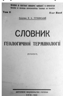
Фото 5. Обкладинка термінологічного словника з геології П. Тутковського

Довідкове видання "Словник геологічної термінології : (проект)" [19] П. Тутковського (1858—1930) — видатного вченого-енциклопедиста, геолога, географа, палеонтолога, краєзнавця, музеєзнавця, пам'яткознавця, організатора науки, академіка ВУАН (1919) і Білоруської АН (1928) — побачило світ у Державному видавництві України в Києві (фото 5). Книга, підготовлена науковцем 1919 р., стала першою в Україні, в якій упорядковано геологічну термінологію та номенклатуру. Словник містить українські та російські відповідники геологічних термінів і понять. Видання широко використовували в музеях природничого профілю під час складання облікової документації на музейні зразки — натуралії. Довідник є унікальним у природничому мовознавстві й донині, його використовують сучасні вчені в галузі геологічних і географічних наук, а також природничики-музейники.