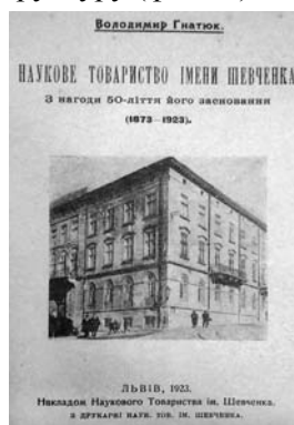
Фото 6. Обкладинка книги В. Гнатюка

У львівській друкарні НТШ видано брошуру — своєрідний звіт про його діяльність — "Наукове товариство імені Шевченка. З нагоди 50-ліття його заснування (1873—1923)" [20], яку підготував видатний етнограф, мовознавець, літературознавець, музеєзнавець, пам'яткознавець, академік ВУАН (1924) В. Гнатюк (1871—1926). У книзі докладно висвітлено діяльність товариства та подано його структуру (фото 6).