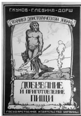
Фото 2. Обкладинка другої частини книги Г. Левіної-Дорш і Г. Кунова

Книга видатного вченого-економіста, публіциста, громадського діяча М. Зібера (1844—1888) "Очерки первобытной экономической культуры" [10] побачила світ в одеському Державному видавництві України накладом 5 тис. примірників. Перше видання праці випущено в Москві 1883 р. Книга містить 10 розділів і ґрунтується на аналізі значного за обсягом фактичного етнографічного матеріалу. Видання стало подією в тогочасній історичній науці, адже вперше в Європі висвітлювало особливості соціально-економічного розвитку стародавніх соціумів. У зазначений період матеріали книги використовували в музеях під час оформлення експозицій з історії первісного суспільства. Книга М. Зібера і сьогодні залишається однією з небагатьох фундаментальних праць із первісної економічної культури.