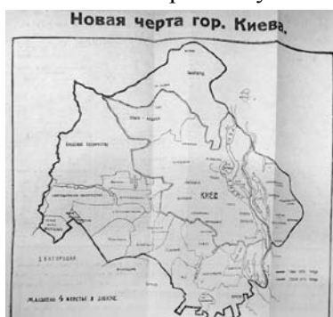
Фото 7. Карта з книги "План-справочник г. Киева, 1923 г."

ували під час оформлення експозицій з історії соціально-економічного розвитку міста.