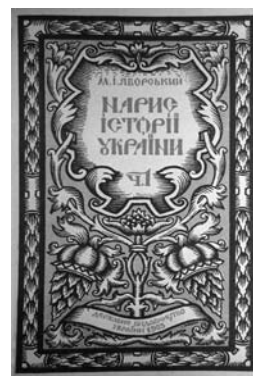
Фото 3. Обкладинка першої частини книги М. Яворського

У Державному видавництві України вийшла перша частина підручника "Нарис історії України" [13] історика М. Яворського (1884—1937). Наклад видання як для того часу був значним — 15 тис. примірників (фото 3). Підручник охоплює добу первісності — литовську добу. Містить вступ, що складається з трьох частин: "І. Що таке історія. — Завдання історичної науки", "ІІ. Історія України. — Особливості цієї історії", "ІІІ. Методологічні уваги до історії України" [13, с. 3—22]. Структуру видання вчений поділив на п'ять відділів із тематичними розділами та розгорнутою бібліографією з історії країни. Підручник фактично став настільною книгою для музейних закладів у справі висвітлення давньої та середньовічної історії України.