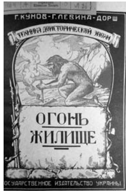
Фото 1. Обкладинка першої частини книги Г. Левіної-Дорш і Г. Кунова

красознавчих музеїв. Один з авторів — Г. Кунов (1862—1938) — історик-марксист, соціолог, етнограф, публіцист.