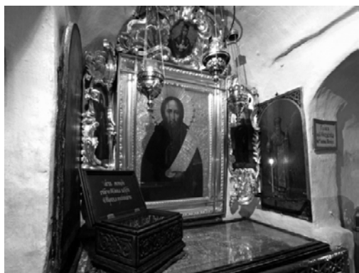
Ікона та кенотаф преподобного Феодосія Печерського на Дальніх печерах Києво-Печерської лаври

Відомі також зображення прпп. Антонія та Феодосія на різьблених дерев'яних хрестах