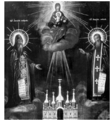
Преподобні Антоній і Феодосій Печерські біля ікони Успіння Пресвятої Богородиці та Успенського собору. Гравюра Іллі. Патерик. 1661 р.

На більшості ікон, як і на Свенській, Антоній має суворий, зосереджений і самозаглиблений вираз обличчя, на відміну від більш живого й відкритого лику Феодосія. Антонія зображували як сивобородого старця-схимника, а Феодосія — як людину середнього віку з непокритою головою. Поширеними були й такі іконографічні композиції, як Богородиця Печерська та ікона Успіння Пресвятої Богородиці.