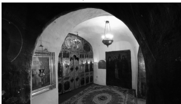
Храм преподобного Феодосія на Дальніх печерах