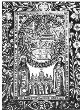
Преподобні Антоній і Феодосій Печерські біля ікони Успіння Пресвятої Богородиці та Успенського собору. Патерик. 1661 р.