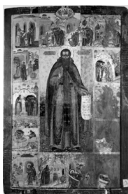
Преподобний Феодосій Печерський із житієм у 14 клеймах. XVII ст. Іконописна майстерня Києво-Печерської лаври