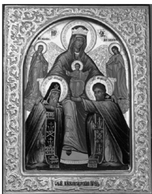
Печерська нерукотворна ікона Богородиці з преподобними Антонієм і Феодосієм Печерськими, розміщена у Великій церкві Києво-Печерського монастиря у 1085 р.