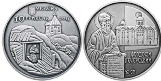
Пам'ятна монета НБУ, присвячена преподобному Феодосію Печерському