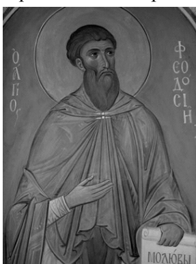
Преподобний Феодосій Печерський. Фреска у Свято-Успенській Святогірській лаврі

XVII—XVIII ст., що зберігаються в лаврській колекції.