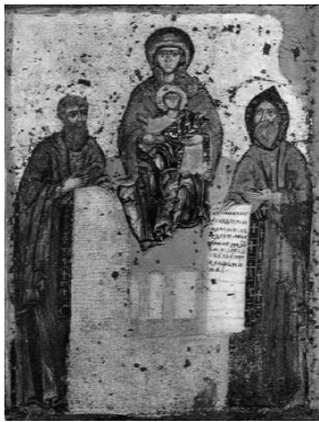
Печерська (Свенська) ікона Божої Матері (ліворуч — преподобний Феодосій, праворуч — преподобний Антоній)

Найдавнішим зображенням Феодосія вважають Свенську ікону Богородиці 1288 р. Такий вигляд святого був поширеним в іконографії, починаючи з XVI ст. Різниця в індивідуальних рисах Антонія та Феодосія набула усталеності в печерській іконографії.