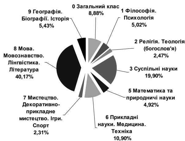
Діагр. 1. Розподіл книг і брошур за класами УДК

Результати бібліометричного аналізу бібліографічної інформації щодо книг і брошур у межах класів УДК подано в табл. 1—10 (кількісний і відсотковий розподіл відповідно до загальної кількості записів у класі).