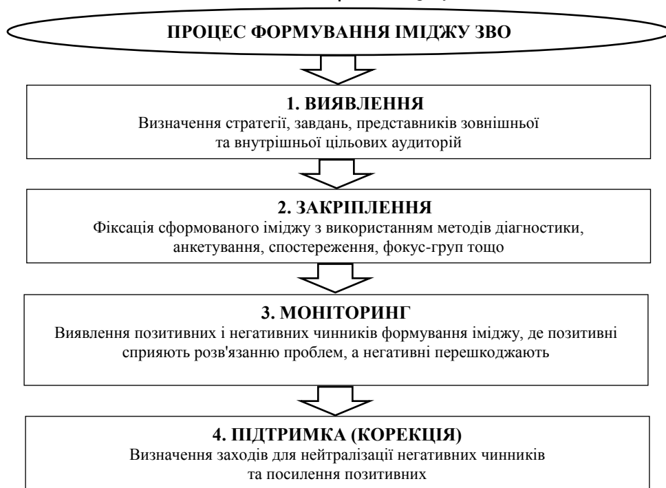
Схема 1. Процес формування іміджу ЗВО

Слід докладніше зупинитися на структурі іміджу закладу освіти, що поділяється на внутрішній та зовнішній. Різниця між ними полягає в тому, що внутрішній імідж відображає реальні аспекти функціонування університету, а зовнішній є штучно сформованим, спрямованим "на публіку". Внутрішній імідж зазвичай впливає на зовнішні показники формування образу ЗВО.