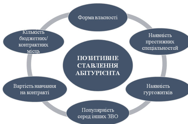
Схема 2. Іміджеві маркери формування позитивного ставлення до ЗВО абітурієнтів