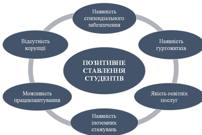
Схема 4. Іміджеві маркери формування позитивного ставлення до ЗВО студентів

Позитивне ставлення студентів формується насамперед завдяки можливості здобути якісні знання та навички, а також перспективі подальшого працевлаштування. Важливими аспектами є участь у державних і міжнародних програмах, конференціях, стажування за кордоном.