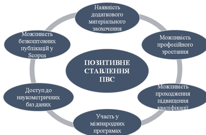
Схема 5. Іміджеві маркери формування позитивного ставлення до ЗВО професорсько-викладацького складу

Головним чинником позитивного ставлення до закладу вищої освіти з боку професорсько-викладацького складу є можливість, окрім здійснення освітньої діяльності, підвищувати науковий рівень: брати участь у міжнародних програмах (академічна мобільність), уміщувати безоплатні публікації у Scopus і Web of Science тощо.