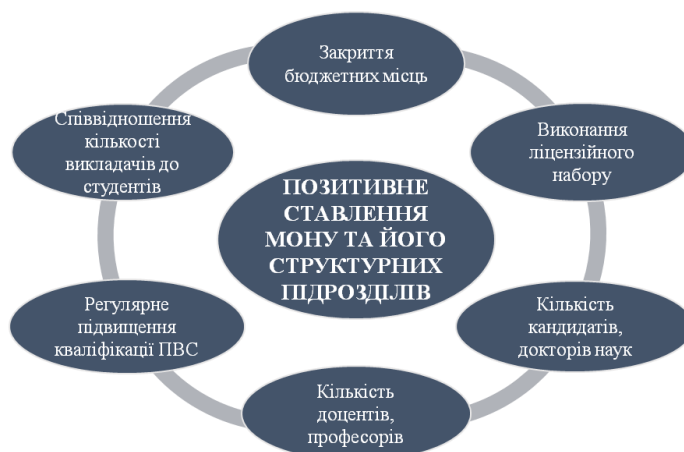
Схема 3. Іміджеві маркери формування позитивного ставлення до ЗВО МОНУ та його структурних підрозділів

Абітурієнти насамперед приділяють увагу престижності навчального закладу, його позиції в міжнародних і національних рейтингах, а також умовам освітнього процесу: наявності популярних спеціальностей (у сфері ІТ, іноземних мов, економіки та права), вартості навчання за контрактом, наявності й стану гуртожитків, аудиторних приміщень тощо.