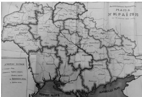
Фото 4. Карта України з книги В. Кистяковського "Нарис географії України"

У книзі професора географії В. Кистяковського (1865—1952) "Нарис географії України. Для шкіл та самонавчання (з малюнками, картами й картографіями)" [15], випущеній у Києві Державним видавництвом значним накладом у 15 тис. примірників, розглянуто типові ландшафти України, а також запропоновано визначення критеріїв щодо їхнього пам'яткоохоронного статусу (фото 4). На жаль, діяльність цього дослідника маловідома й потребує додаткового дослідження [24].