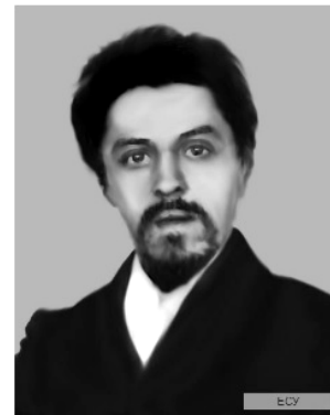
Фото 5. Ю. Вагнер

Книга професора зоології та громадсько-політичного діяча Ю. Вагнера (1865—1946 (?)) "Початковий курс природознавства. Частина перша. Природа нежива", випущена Державним видавництвом Києва, містить матеріали щодо організації природничих кабінетів [17]. До сьогодні долю цього дослідника достеменно не досліджено. Працюючи від 1898 р. у Київському політехнічному інституті (тепер — НТУУ "КПІ ім. Ігоря Сікорського"), він створив зоологічний кабінет при однойменній кафедрі. Від 3 до 24 травня 1918 р. обіймав посаду міністра праці в уряді П. Скоропадського, від 1925 р. оселився в Белграді й зник безвісти 1945 чи 1946 р. [26] (фото 5, https://uk.wikipedia.org/wiki/Вагнер_Юлій_Миколайович ).