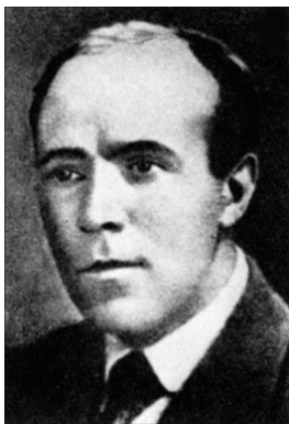
Фото 1. Г. Гринько

У 1922 р. Харківський редакційно-видавничий відділ Наркомпроса накладом 1 тис. примірників випустив матеріали "Третьего Всеукраинского совещания по просвещению..." [10], яке відбувалося 16—18 червня того року у Харкові. Видання містить виступ наркома освіти Г. Гринька (1890—1938) від імені Колегії Наркомпросу. Доля цього державного та громадського діяча була трагічною. Упродовж 1920—1922 рр. він обіймав посаду наркома освіти України. У 1938 р. за сфальсифікованими обвинуваченнями був засуджений до страти, реабілітований 1959 р. (фото 1, http://resource.history.org.ua/cgi-bin/eiu/history.exe?Z21ID=&I21DBN=EIU&P21DBN=EIU&S21STN=1&S21REF=10&S21FMT=eiu_all&C21COM=S&S21CNR=20&S21P01=0&S21P02=0&S21P03=TRN=&S21COLORTERMS=0&S21STR=Grynko_G ). Попри певну заідеологізованість виступу, у ньому було порушено питання розвитку музейної та пам'яткоохоронної справи й виділення фінансування на облаштування музейних закладів [22].