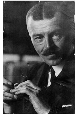
Фото 2. Ф. Шміт

Харківський редакційно-видавничий відділ НКО 1922 р. опублікував працю "Пам'ятки староруського мистецтва (про досліджування й видання їх)" [13] видатного вченого, академіка Всеукраїнської академії наук Ф. Шміта (1877—1937), який за сфабрикованими обвинуваченнями був розстріляний 1937 р., а 1956-го реабілітований [2—4; 8; 13] (фото 2, https://uk.wikipedia.org/wiki/Шміт_Федір_Іванович ).