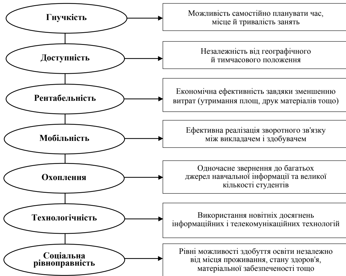
Схема 1. Основні характеристики особистісно орієнтованого способу організації дистанційного навчання

Визначимо основні риси особистісно орієнтованого способу навчання з використанням платформ дистанційного навчання [6] (схема 1).