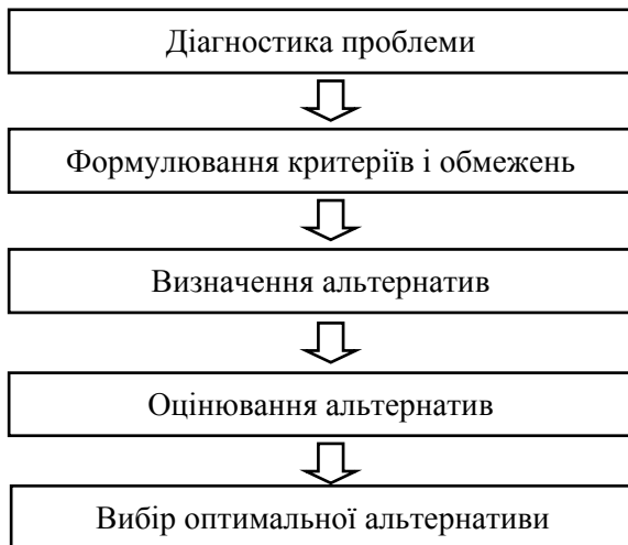
Схема 2. Етапи ухвалення раціональних рішень