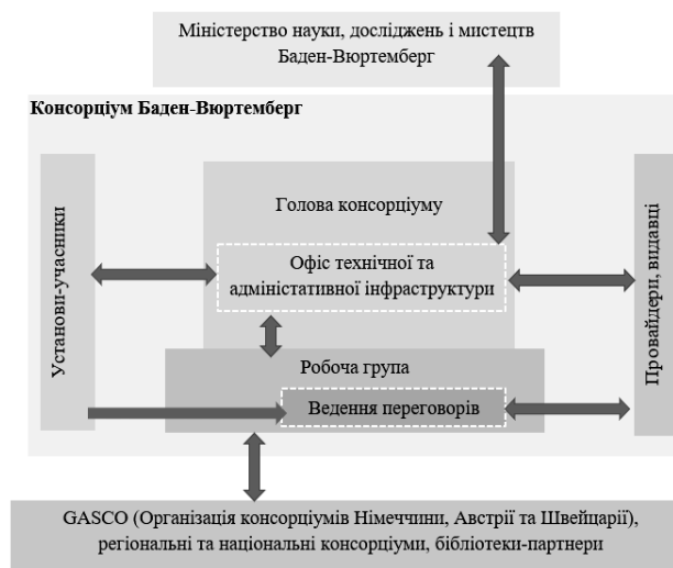
Схема 1. Організаційна структура Консорціуму Баден-Вюртембергу

Управління Консорціумом здійснює Міністерство науки, досліджень і мистецтв землі Баден-Вюртемберг (схема 1).